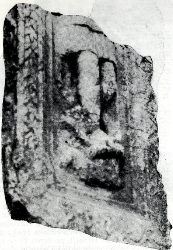
Sl. 2 — Cipus sa likom Atisa iz Crvice. Gornji dio je uglavnom propao

glavi, dok su uske hlače prilegle uz tijelo. Figura je predstavljena u profiliranom okviru koji na rubovima zatvara široka bordura od gusto poredanih listova, a koja na donjoj strani prelazi u volute. Bordura se nastavlja i na uže strane cipusa koje su, izgleda, bile prazne.