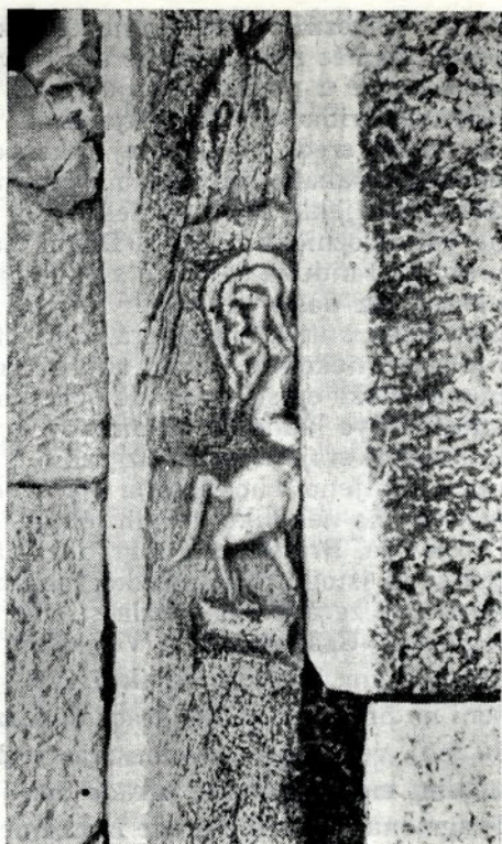
Sl. 4 — Fragment nadgrobnog spomenika ugrađen u Milicijsku stanicu u Skelanima

Spomenik je 1964. godine izoran iz njive — prilikom dubokog oranja — uzvodno od Milicijske (ranije Financijske) stanice u Skelanima, na prostoru rimskog naselja. Na njivi se nalazi i jedna izdubena kamenica od jedrog vapnenca. Kažu da je njiva puna rimskog materijala, pa plug zapinje, kao i u slučaju nalaza opisane figure.