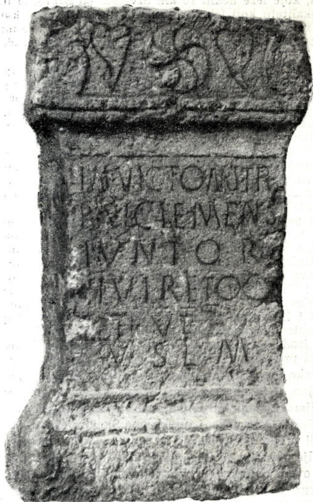
Sl. 5 — Žrtvenik u čast Mitre (Invicto Mithrae) iz Rogatica

njen, kao i obično, u tri nejednaka dijela: strehu (v. 22 cm), natpisno polje (v. 62 cm) i bazu (v. 15 cm). Na prednjoj strani strehe, između stiliziranih aktroterija, nalazimo plastičnu spiralnu rozetu koja treba da simbolizira sunce, a to je sam Mitras. S obje strane rozete (Wirbelrosette) urezan je po jedan izduženi bršljanov list. Bršljan, koji je poznat kao simbol Dionizova kulta, vrlo je čest na nadgrobnim spomenicima sa jasno izraženom simbolikom; ali on ovdje ima, vjerojatno, samo dekorativnu ulogu, ukoliko se ne radi o pojavi kulturnog sinkretizma (sl. 5).