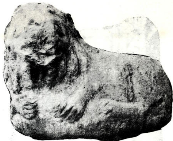
Sl. 3 — Figura lava iz Skelana

spomenutih cipusa, vidio i »tesana kamenja i kapitela od pilastara«, ali se od svega toga na Rašću sačuvao još samo jedan stećak, monolitni sanduk od škrljevca sa postoljem, dok se iz njive izoravaju ljudske kosti. Prema tome na Rašću je bilo pokopno mjesto Crvičana u srednjem vijeku, a rimski su spomenici bili upotrijebljeni kao nadgrobno kamenje.