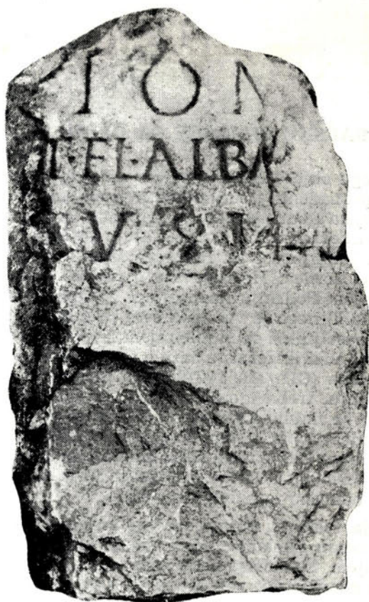
Sl. 1 — Ara iz Crvice

— dobili municipalitet od Flavijevaca, kao i Sirmium koji je vršio snažan uticaj u dolini Drine. 6 Tito Flavije Alban (kognomen Albanus, često se javlja na Drini, i vjerovatno je samo romanizirani oblik odgovarajućeg keltskog imena) i pored pune onomastičke rimske formule ( tria nomina ), pripada onome sloju domaćih ljudi, koji su zarana stekli rimski civitet.