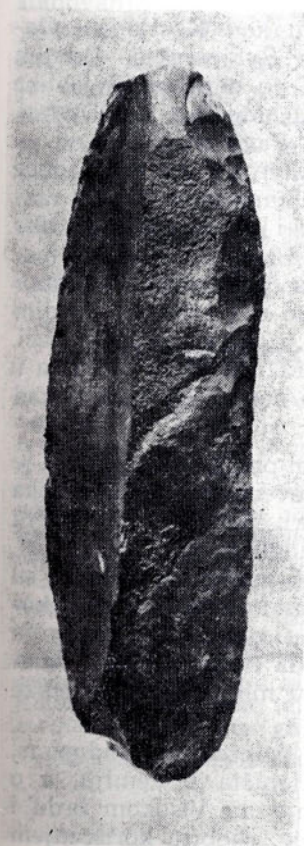
Sl. 3. Londža u Makljenovcu kod Doboja, retuširana lamina (moustérien)

zanju zakloništa — bile su potpuno izbrisane. Preciznim mjerenjima položaja kremenih artefakata na Visokom brdu u Lupljanici kod Dervente i Kadru kod Odžaka, pokušalo se ustanoviti kolike su udubine u nekadašnjoj površini prebivališta, a time i mogućnosti identifikacije mjesta sa zemunicama. No, ugibanja tla i vertikalna pomicanja kremenica na nekom prostoru mogla su nastati i zbog smrzavanja, odnosno otkravljanja zemljišta, klizanja zemljišta i drugih uzroka.