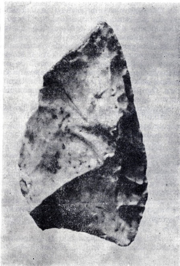
Sl. 4. Londža u Makljenovcu kod Doboja, moustérienska strugalica

Mlade paleolitske nastambe su obično ukopavane u zemlju, ali to nije pravilo jer se već na više mjesta moglo ustanoviti postojanje šatora, koji su bili podizani na površini zemlje bez ikakve prethodne pripreme terena.