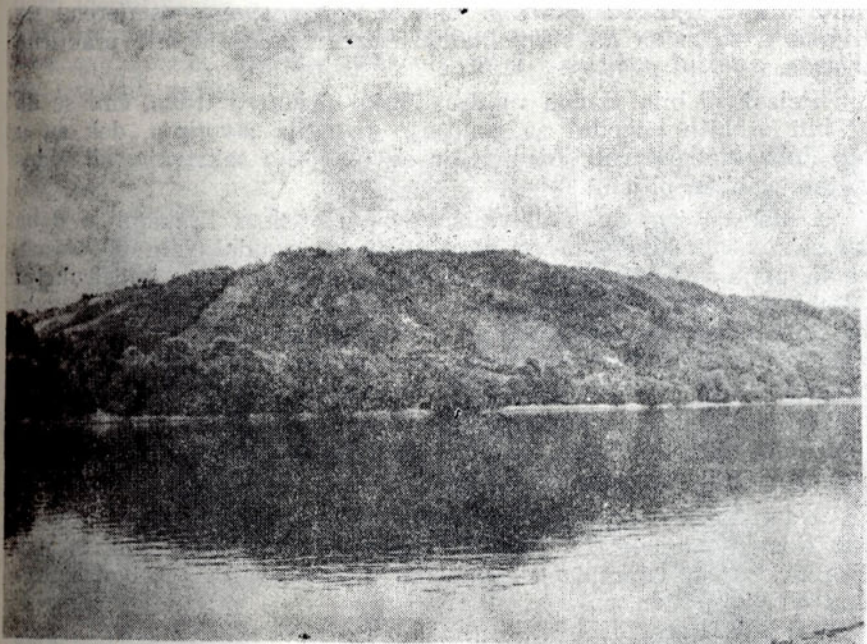
Sl. 2. Kadar kod Odžaka, pogled sa Save prema nalazištu

epohe čije spomenike sadrži ova ilovača. U sjevernoj Bosni su tardiglacijalni slojevi potpuno erodirani, tako da se pri vrhu slojeva ilovače danas vjerojatno nalaze tragovi paleolitskih stanica iz nekoliko raznih epoha.