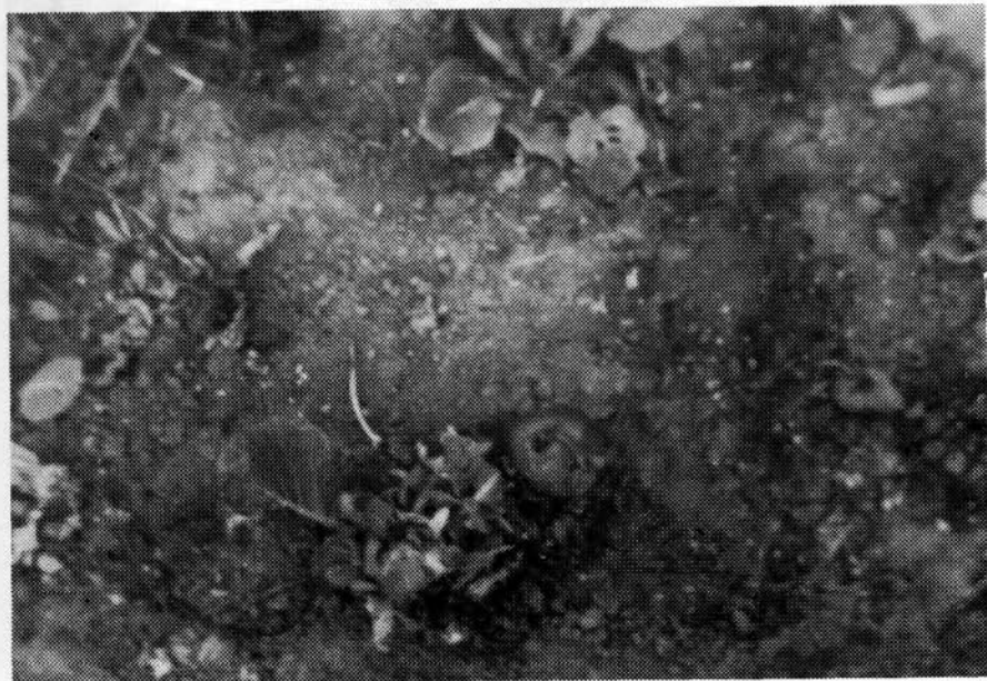
Sl. 3. Kljucani paradajz

Poznato je da su gačci svaštojedi, jer se hrane raznolikom hranom, biljnom, životinjskom i anorganskom. Ovu činjenicu potvrđuju i rezultati dobijeni na osnovu analize želudačnog sadržaja disekovanih jedinki na području Tuzle. Izvršena je disekcija pet adultnih jedinki. Kod jedinki disekovanih u mjesecu martu u želudcu su bile prisutne uglavnom materije životinjskog porijekla. To je utvrđeno na osnovu ostatka dijelova insekata (Coleoptera, Hymenoptera, Diptera) dok se veći broj insekata nije mogao determinisati, jer su već bili razoreni u procesu varenja. Zatim, su nadene ljušture puževa (Gastropoda), te ostaci dijelova tijela glodara (Rodentia). Iako je analiza želudačnog sadržaja vršena u