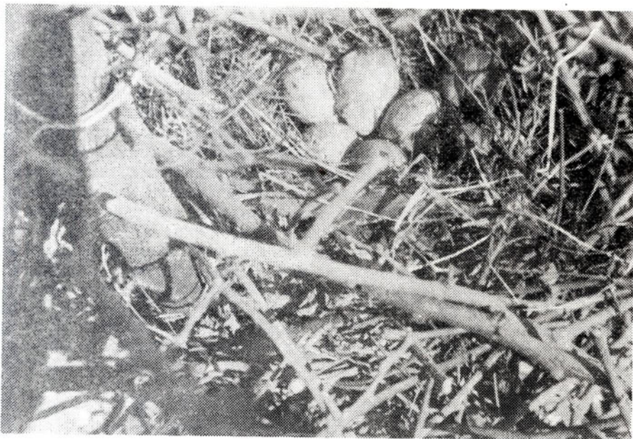
Sl. 2. Jaja u gnijezdu

Poslije perioda parenja ženke nose jaja. Nošenje jaja u koloniji u Tuzli otpočelo je dosta rano, jer su pri obilasku kolonije 12. marta, 1990. nađena dva razlupana jaja, a 16. marta, 1990. u jednom gnijezdu nađeno je pet jaja sivo-zelene boje sa maslinasto-zelenim pjegama. Značajno je napomenuti da su se razlikovala kako po boji tako i po veličini, jer su jedna bila svjetlija a druga tamnija, odnosno veća i manja. To znači, da jedna ženka može polagati jaja različite veličine i boje. Raspored jaja je takav da su šiljati krajevi okrenuti u sredinu gnijezda što omogućava lakše zagrijavanje jaja.