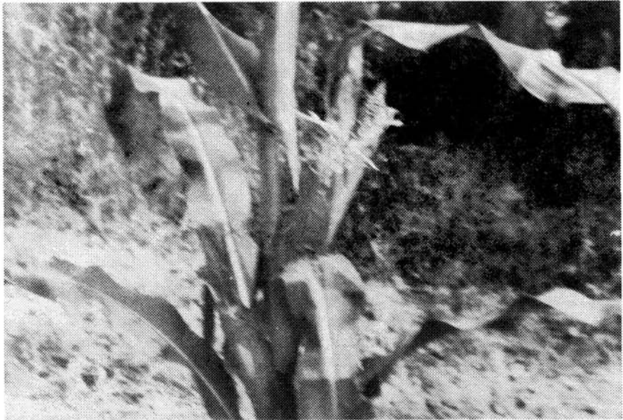
Sl. 4. Oštećeno klip kukuruza

vrijeme nicanja usjeva nisu nađeni dijelovi mladih biljaka. Na osnovu toga može se zaključiti da se gačci u proljetnim mjesecima ne hrane biljnom hranom. Prema navodima (Vertsea (55) gačci to čine kod bolesnih žutih biljaka koje su oštećene od strane larvi nekih insekata Melolontha , pa biljke požute što privlači pažnju gačaca. Što se tiče hranljivih sastojaka biljnog porijekla bili su prisutni u želudcu jedinki diskovanih u jesenjem periodu u mjesecu septembru. Nađeni su celulozni ostaci ljuske zrnevlja, te sjemenke ploda paradajza i bundeve. (Sl. 3.)