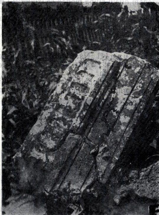
Sl. 1 — Epistilna greda sa njive J. Vidmara u Bratuncu

2. Gezim s Posebni blokovi čine gezims koji se sastoji od jednostavnih konzola s kazetama u kojima se nalaze plastični prikazi četvorolistih cvjetova i dosta sumarno prikazana ljudska lica. Poviše konzola poteže se manja kima, a nad njom velika završna kima. Konzole su oko 15,00 cm dužine, 9,50 do 10,50 cm širine, a razmak između njih iznosi 16,50 sa 17,00 cm. Preko konzola iskače jednostavni profil širine 1,20 cm, tako da su kazete između njih četvrtastog oblika. Visina konzola iznosi približno 5,50 cm. Širina grede u razini najvećeg ispada kime iznosi 94,50 cm.