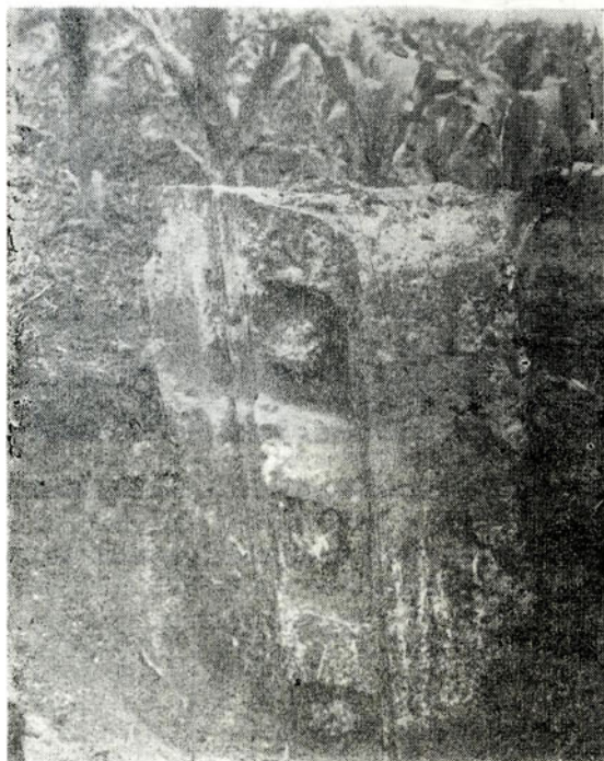
Gezims sa nekropole u Voljevici

Ostaje još da se pozabavimo epistilnim fragmentima koji su u ovom području najbrojnije zaštopljeni. Izračnavanje modula građe-