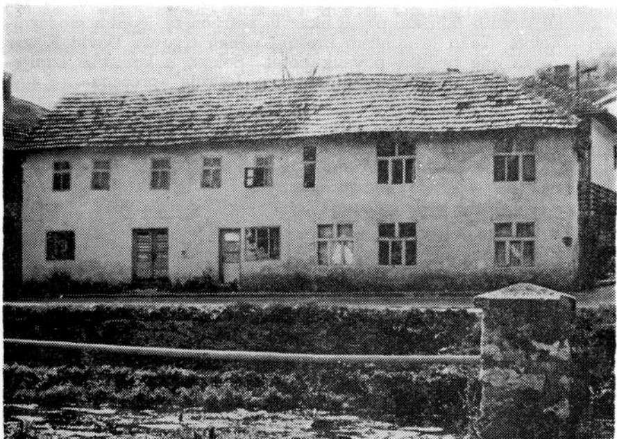
Sl. 1. Kuća u Gračanici u kojoj je stanovao prvi doseljeni Jevrej

Ti Jevreji su organizovali prikupljanje žita, rekvirirali sve vođenice u mjestu i okolnim selima i nadzirali da one rade neprekidno. Istodobno su preuzeli i sve pekare u mjestu, a postavili su i nekoliko poljskih pekara na raskršću puteva iz Gračanice i Tuzle (po prilici negdje blizu Korića hana). Tako je ustanička vojska imala obezbijeden stalan dotur svježeg hljeba, a sami ustanici su sa sobom nosili suhu hranu: sir, luk, pekmez i još ponešto, a bilo je svugdje i svježeg voća i povrća.