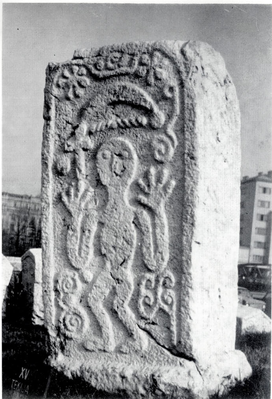
Sl. 1. — Hrnčíci