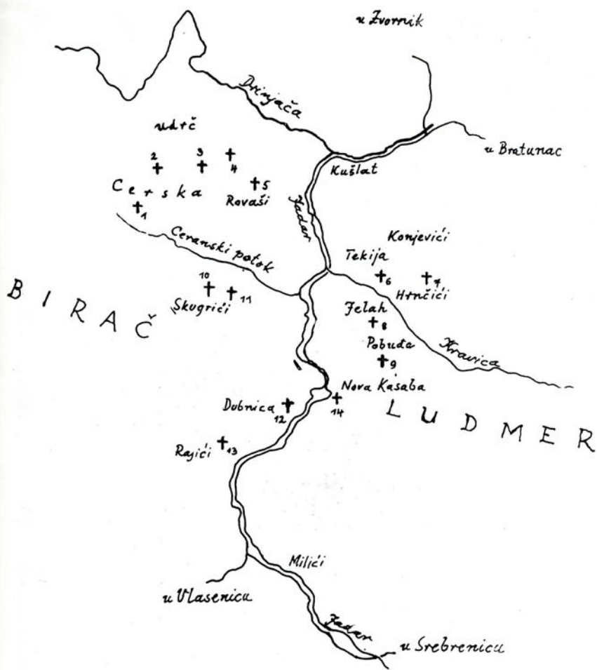
Topografski pregled nekropola