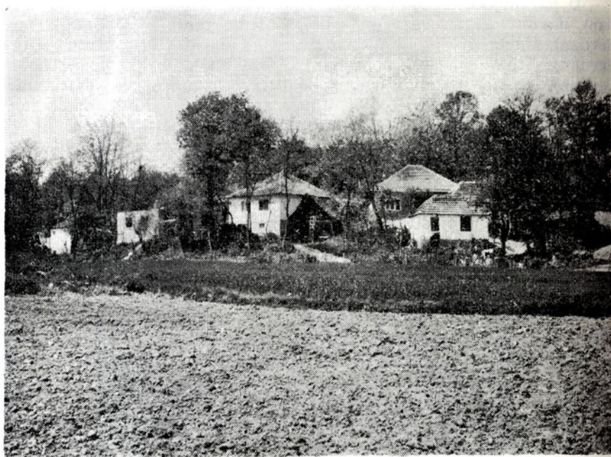
Sl. 2. Romske kuće duž desne strane puta koji vodi u Skočić

Nismo mogli doznati ništa poblize o porijeklu Mićića (1 k, 1 k, 3 k), Cvjetinovića (1 k, 1 k, 4 k), Gajića (4 k. danas), Filipovića (2 k. danas), Jankovića (3 k. danas) i Rikića .