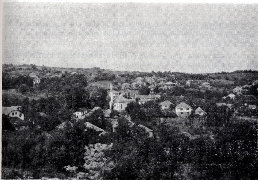
Sl. 4. Pogled na dio Gornjeg Šepka

U novije vrijeme veoma je uočljiva pojava izgradnje novih kuća uz zborničko — bijeljinski put, dakle domaćinstva migriraju iz Gornjeg Šepka, formira se novo naselje koje u narodu nosi ime Srednji Šepak. U vrijeme naših istraživanja 1976. god. ovdje je bilo oko 40 novoizgrađenih kuća, a 1982. godine bilo ih je oko 60. Njihovi vlasnici su uglavnom iz Gornjeg Šepka.