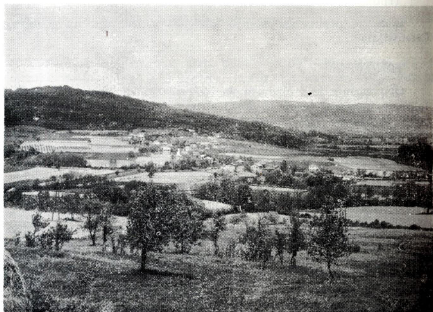
Sl. 3. Pogled na Donju Trnovicu

O porijeklu porodice Petrovića (1 k, 3 k, 3 k) nismo ništa doznali, ali su nam kazivači saopštili da su »oni ( Petrovići -moja primj.) najprije 'Ercegovci«.